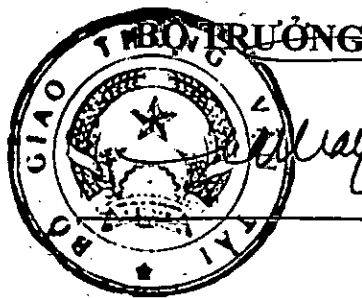
Đinh La Thăng